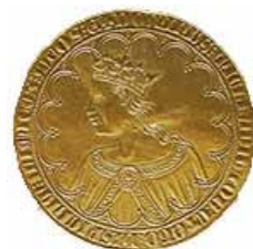
Dobra de a 10.

Juan II emite con la ceca de Sevilla dobla de a 20 (superior a 90 gr depositada en la Biblioteca Nacional de Francia) y dobla de a10