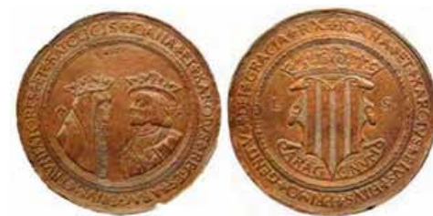
Centen de Juana y Carlos.

20 ducados. (70 gr) Esta moneda, única que conocemos, perteneció a la colección