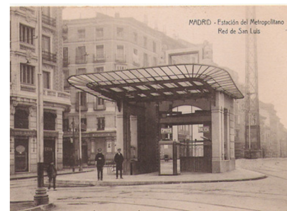
Desaparecido templete del Metro, Red de San Luis.