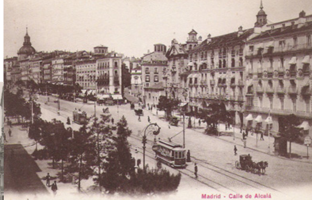
Madrid - Calle de Alcalá