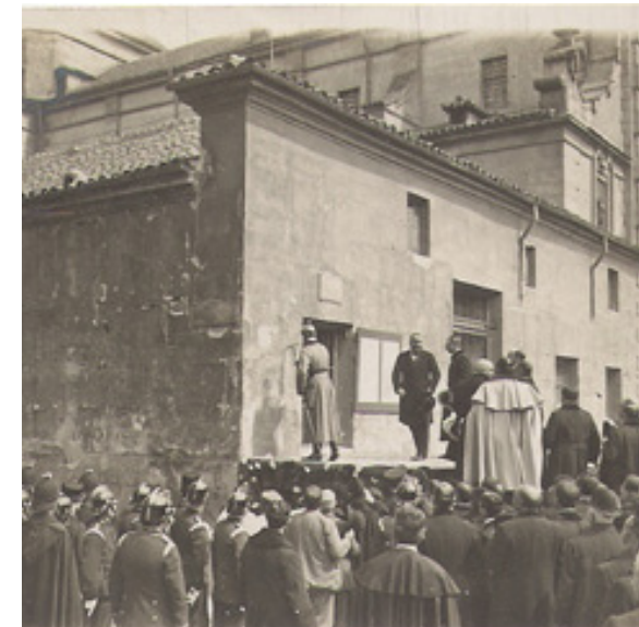
"Piquetazo" del inicio de las obras.