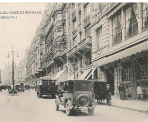
Vista del primer tramo, Conde de Peñalver.

En la revista madrileña Madrid Histórico publicamos a lo largo de todo el año una decena de artículos tratando distintos aspectos poco conocidos de su historia, ilustrándolos con multitud de fotografías, documentos y sobretodo postales del archivo colección madridantiguo. Tan solo trataremos aquí de referirles mínimamente algunas de las diferentes entregas junto a alguna postal alusiva, a título de muestra. Un artículo se dedicó a la ceremonia de apertura de las obras en 1910. Copiando el título de "El Rey hinca el pico", que ya usó Serrano Anguita -en velada alusión a las ideas republicanas que pregonaba su periódico- narramos toda la ceremonia que se desarrolló en la esquina de la desaparecida calle de San Miguel con la de Alcalá reuniéndose toda la familia real y las autoridades. Con el derribo de la casa del cura de la parroquia de San José se inician unas obras para conectar la calle de Alcalá con la desaparecida plaza de Leganitos, junto a la futura plaza de España. El proyecto inicial databa de 1862, pero infinidad de complicaciones lo retrasaron largos años y finalmente supondría el derribo de 315 casas y la desaparición total de 14 calles y 34 parcialmente. Las obras se dividían en tres tramos, que se construyeron sucesivamente y cada uno con sus propias características, terminándose ya en los años 30. Así el primero fue de Alcalá a la Red de San Luis -Avenida del Conde Peñalver-, hasta Callao, -la de Pi y Margall- y hasta