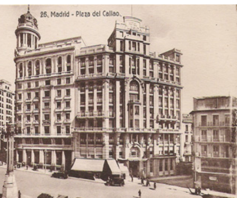
Plaza del Callao, con el desaparecido Hotel Florida.