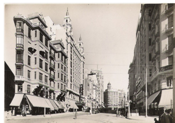
Tercer tramo, Eduardo Dato.

La Gran Vía fue testigo de la evolución política española, proclamándose la República, quemándose en ella la iglesia de los Jesuitas y, ya finalizada la obra del tercer tramo de la calle, se produce la terrible guerra civil, durante la cual los edificios de la Gran Vía -rebautizada como "Avenida del quince y medio"- sufrieron grandes destrozos debido a los bombardeos dirigidos al edificio de la Telefónica desde la Casa de Campo, recogido todo ello en un buen número de fotografías, tema al cual también se le dedicó otro reportaje.