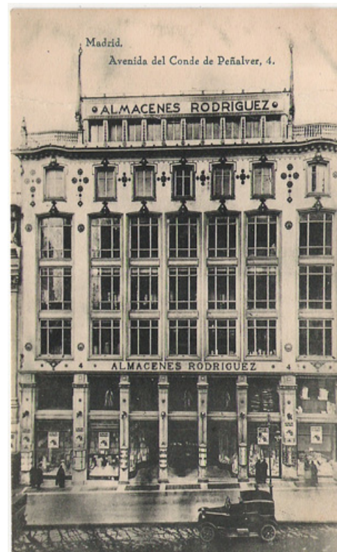
Edificio derribado de los Almacenes Rodríguez.

la plaza de Leganitos-, -la de Eduardo Dato-, hoy todas unificadas bajo el nombre de Gran Vía. La Gran Vía fue testigo de la evolución política española, proclamándose la República, quemándose en ella la iglesia de los Jesuitas y, ya finalizada la obra del tercer tramo de la calle, se produce la terrible guerra civil, durante la cual los edificios de la Gran Vía -rebautizada como "Avenida del quince y medio"- sufrieron grandes destrozos debido a los bombardeos dirigidos al edificio de la Telefónica desde la Casa de Campo, recogido todo ello en un buen número de fotografías, tema al cual también se le dedicó otro reportaje.