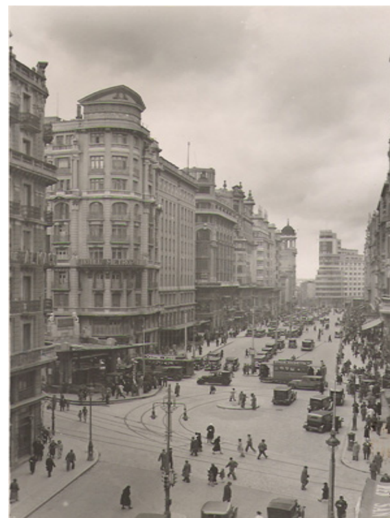
Vista del segundo tramo, Pi y Margall.

la plaza de Leganitos-, -la de Eduardo Dato-, hoy todas unificadas bajo el nombre de Gran Vía.